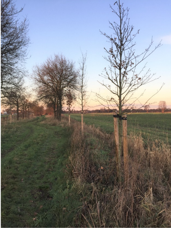
De inplant van nieuwe bomen langs de A27 is nog niet helemaal afgerond.