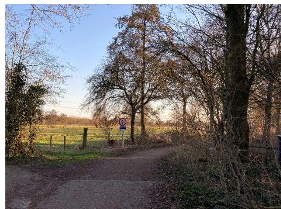
Noordzijde van het Prinsenlaantje. Rechts stond sinds 2018 een QR-bord van de SBP. Vandalen hebben het onlangs weggehaald. Wij plaatsen binnenkort een nieuw bordje.

Voor actuele zaken: www.prinsenlaantje.nl